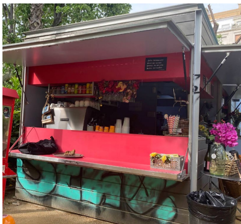
Imatge 7 Imatges generals de la guingueta oberta