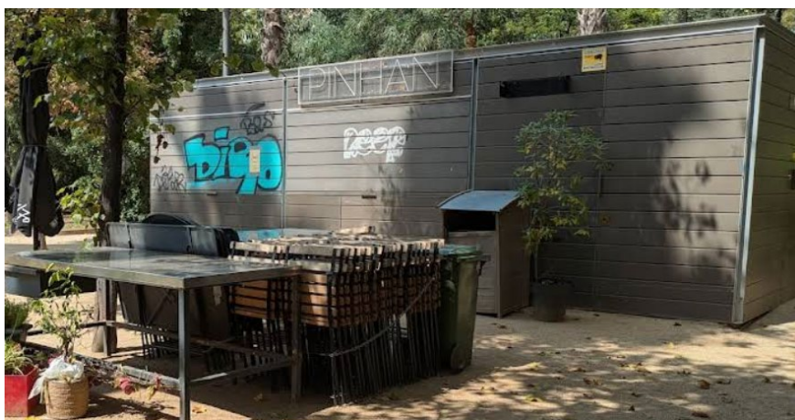
Imatge 4 Pintades a l'exterior de la guingueta.