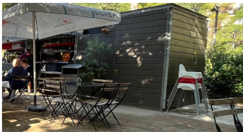
Imatge 5 Imatges generals de la guingueta