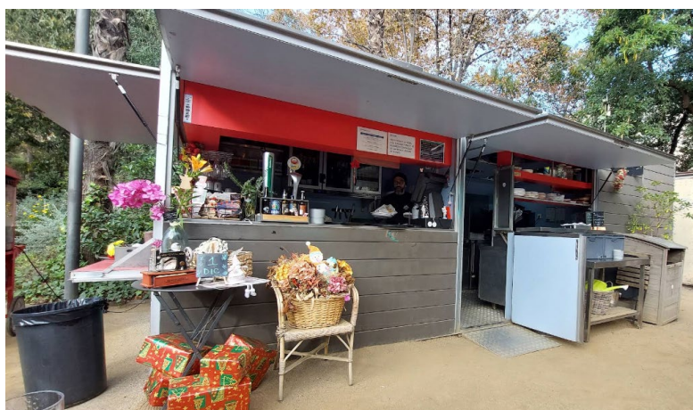
Imatge 6 Imatges generals de la guingueta oberta