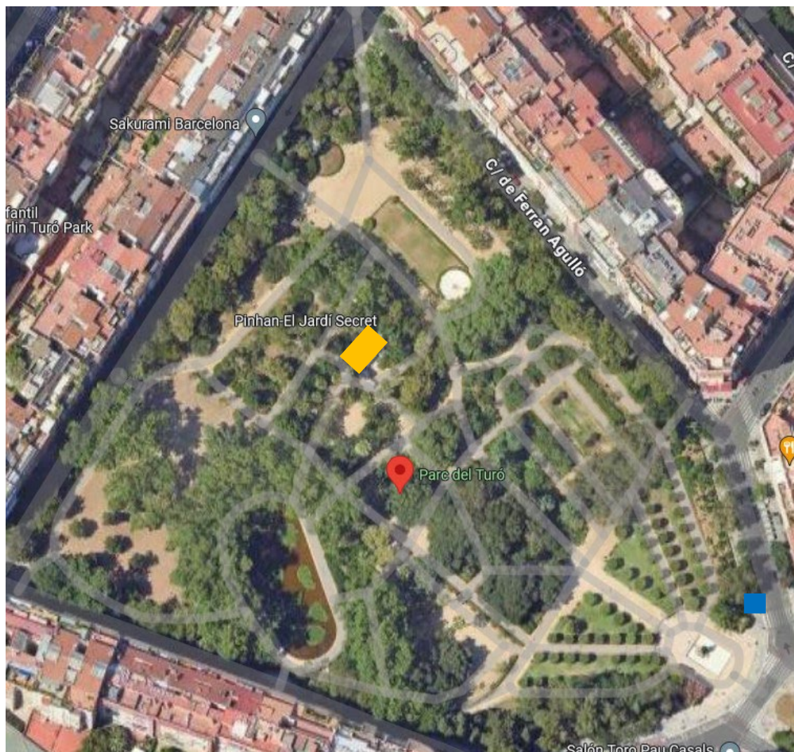
Imatge 1 Emplaçament de la Guingueta